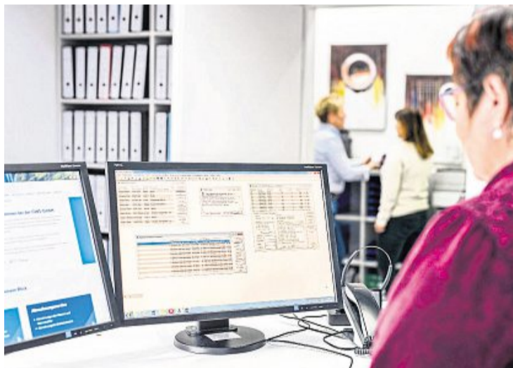
Die GWS GmbH setzt auf innovative Software, die zu einer optimalen Organisation und schlanken, weitgehend fehlerfreien Abläufen beiträgt. Die GWS-App begleitet den Kunden jederzeit mobil und gewährleistet die Bearbeitung von Anliegen rund um die Uhr.

Die für die Abrechnungen benötigten Daten tauscht die GWS inzwischen mit ihren Messdienstleistern über eine Schnittstelle aus. Die Heizkostenabrechnungen werden im PDF-Format ins Verwaltungsprogramm eingespielt, dort automatisiert mit den Betriebskostenabrechnungen zusammengeführt und schließlich über das Kundenportal an die Empfänger verteilt. Dieses Kundenportal von „casavi“, das die GWS seit Anfang 2019 nutzt, wird automatisch synchronisiert. Rund 70 Prozent der betreuten Eigentümer und Mieter kommunizieren bereits darüber mit der Hausverwaltung und rufen benötigte Dokumente wie Erklärungserklärungen dort selbstständig ab. „Wir haben dadurch in diesem Jahr rund 50.000 Seiten weniger Papier ausgedruckt. Das ist echter Umweltschutz. Doch das funktioniert nur, wenn die digitalen Lösungen auch den Kunden gefallen“, stellt die GWS-Chefin fest.