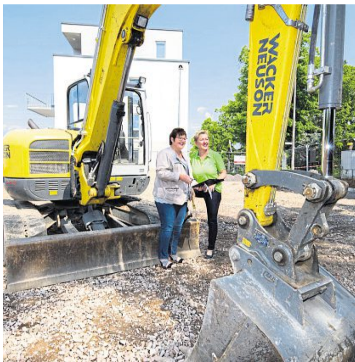
Ihren Sachverstand und ihre Erfahrung bringen die Immobilienexperten der GWS GmbH mitunter schon auf der Baustelle ein.