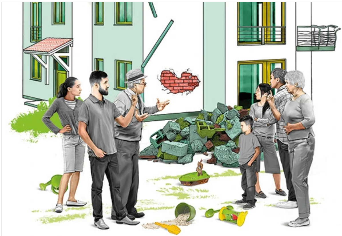
© Thomas Kuhlenbeck / Jutta Fricke Illustratoren-Agentur

Die Beseitigung von Schäden beschließen die Eigentümer. Umsetzen muss das die Hausverwaltung.